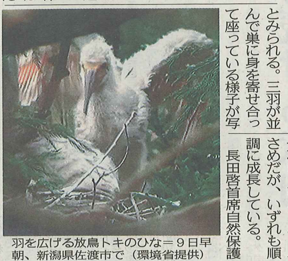
羽を広げる放鳥トキのひな=9日早朝、新潟県佐渡市で

環境省は九日、新潟とみられる。三羽が並んで巣に身を寄せ合っている様子が見られる。鳥トキのひな三羽の映像を公開した。くちばしがさらに長くなり、広がった羽の内側は鮮やかな「朱鷺色」になっていた。順調にいけば五月下旬に巣立ちを迎える。