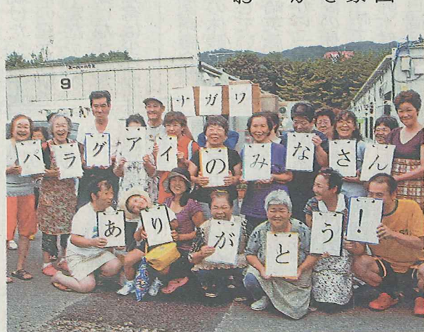
「パラグアイのみならず、ブラジル、アルゼンチン、ウルグアイ、チリ」のメッセージを送る被災者=宮城県山元町で

日々の暮らしの中で見聞きした、ちょっとした話や心温まるニュースをお寄せください。連絡先を明記の上で〒460 8511 中日新聞社会部「虹」係へ。ファクスは052(201)4331。メールアドレスはniji@chunichi.co.jp